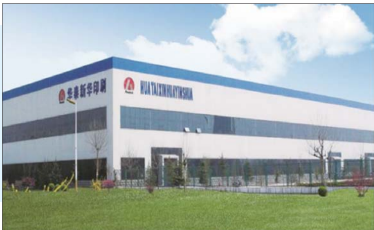
具有悠久历史的华泰新华印刷厂。

本报11月17日讯(记者 崔立慧)近日,省文化和旅游厅、省工业和信息化厅共同组织了第四批山东省工业旅游示范基地评选工作。市文化和旅游局联合市工业和信息化局积极推荐东营市优秀工业旅游企业参选。经会议评审、实地暗访等环节,全省共20家工业旅游企业入选,东营市华泰集团有限公司榜上有名。