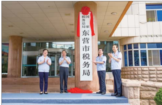
5日,国家税务总局东营市税务局正式挂牌。

自5月1日起,纳税人已可在综合性办税服务厅、网上办税系统统一办理所有税收业务,享受“一厅通办”“一网通办”等优质服务,