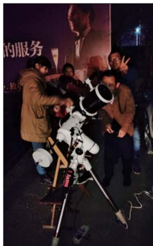
天文爱好者观测活动。