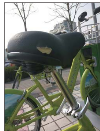
部分公共自行车车座损毁严重。

“前几天巡查时,一站点的自行车车座全部被人扭转了方向,不是斜的就是朝后的。”巡查人员介绍,这种情况一般学校附近较多,“有些孩子调皮,在等车时觉得好玩儿,把车座扭了,有时还会故意把车锁锁上。”