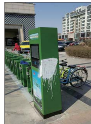
小广告也盯上公共自行车。

据介绍,乱贴乱画的小广告也盯上了公共自行车。“你看,这种就是用黑漆直接喷上的,比较难清理。”工作人员介绍,在锁止器的一侧,经常会有一些喷上去或者粘上去的小广告,“在车桩的下方也有,糊上一块。”