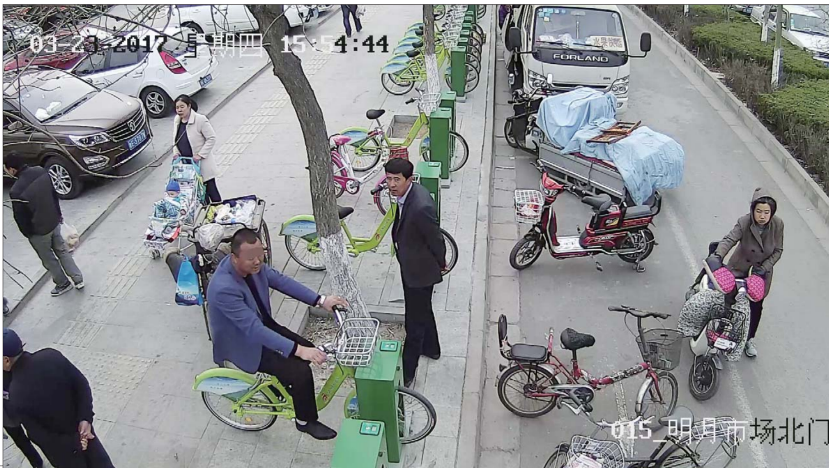
一市民将公共自行车当“动感单车”骑。(监控截图)

工作人员告诉记者,为了引导市民爱惜使用公共自行车,发现不文明现象及时制止,相关部门还将公共自行车站点进行了分区,并安排专门人员按时巡查,“每天早晨六点至晚上八点进行巡查,也会加强对公共自行车设备的检查,发现有损坏立即上报给调度员,然后拉回来维护。”