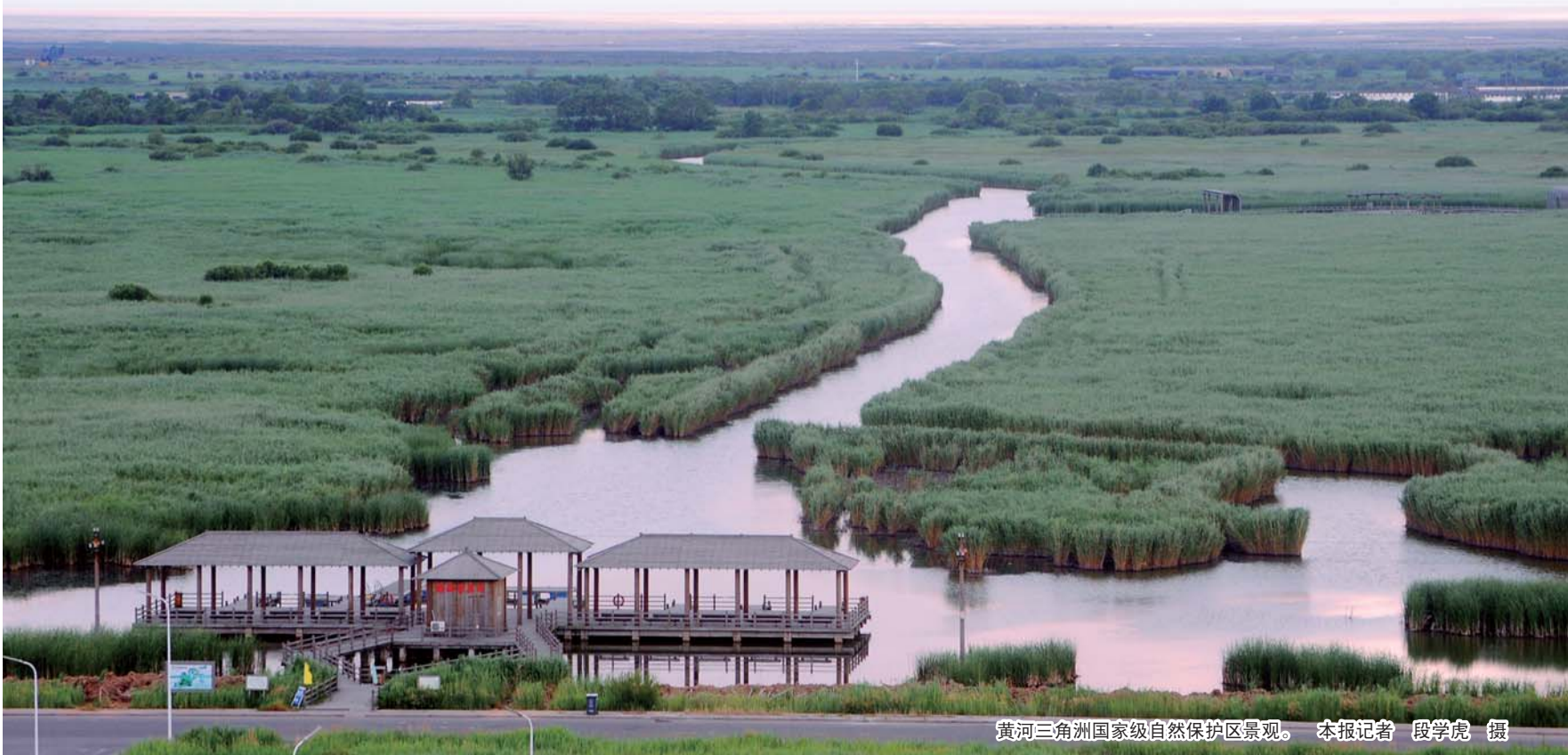
黄河三角洲国家级自然保护区景观。