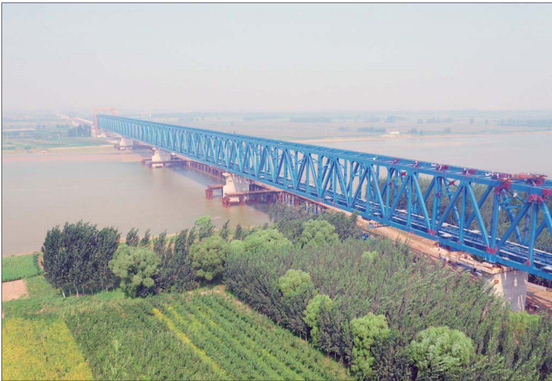
9月8日,黄大铁路黄河特大桥主桥完工。

本报9月8日讯(见习记者 赵环宇) 8日,由中铁十四局集团承建的黄(骅)大(家洼)铁路黄河特大桥主桥工程全部完工。大桥位于利津县境内,距黄河入海口约110公里,主桥全长960米,为黄大铁路唯一的重难点控制性工程。黄大铁路北起河北黄骅,南至山东大家洼,计划于2017年9月建成通车。