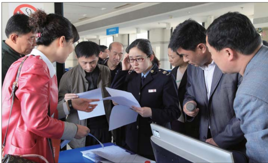
利津县国税局工作人员正在进行政策解答。

全面推开营改增试点，从3月份动员部署到5月1日全面实施，不到两个月时间。面对繁重任务，利津县国税局按照市局的安排部署，倒排工期，精准施策，协力攻坚，营改增工作顺利进行。截至目前，全县已累计确认接收试点纳税人1623户，全面完成接收任务，票种核定、税库银三方协议签署、税控发行、纳税人培训等工作也已全面完成，各项工作准备就绪。