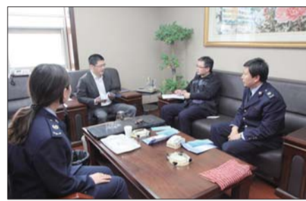
利津县国税局工作人员对纳税人进行上门服务。