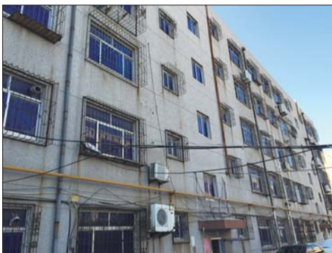
一小区内住户安装着老式钢筋外挂式防盗窗。

此外,该工作人员还建议,如果为了防盗或者防止小孩坠落必须安装,则务必留出安全门,为自己逃生和消防救援创造一道“生命之门”。同时,安全门还应当定期检查,防止锁生锈影响钥匙的正常开启。另外,防盗窗钥匙要保管好,放置在紧急情况下容易取到的地方,且家庭成员都要牢记放在哪里。