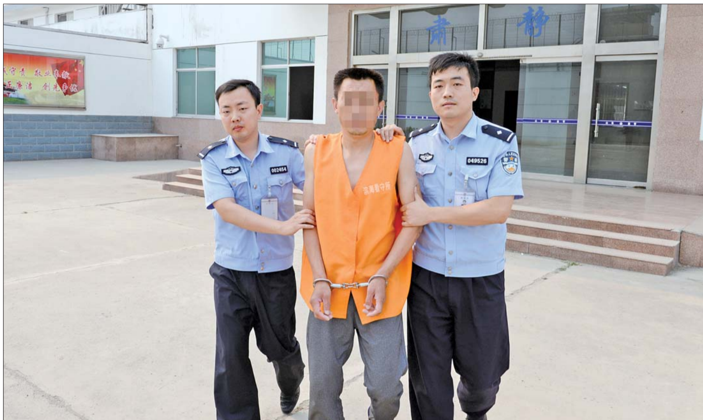
民警押解犯罪嫌疑人。