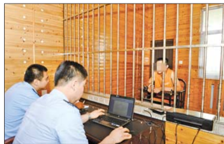
民警审讯犯罪嫌疑人。

确认车辆的款式型号后,专案组民警开始找寻车辆的运行轨迹,在不同路口的交通监控录像中中断断续续发现了它的行踪,但奇怪的是,它所悬挂的车牌号码并不一致。它分别使用过两个鲁J牌照和一个鲁A牌照。这三个牌照的外观看起来和正常的牌照没什么不一样,但牌照号看起来有些别扭。