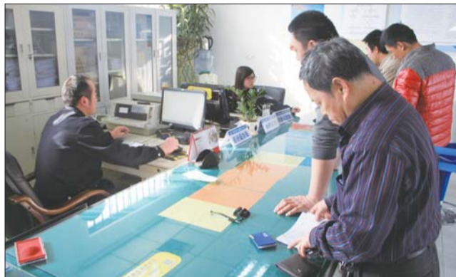
16日,在东营交警直属一大队院内的交通违法行为处理大厅,前来处理交通违法行为的驾驶人在签字确认。

记者从东营交警支队获悉,东营交警支队已接到通知,系统升级后将加装二代身份证读取设备,处理交通违法审核从“人防”变为“技防”。