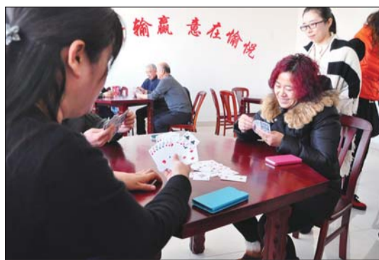
日前,东城街道天水社区举办文艺演出活动,现场的吕剧表演艺术家为社区居民送上了一场吕剧“大年礼”。