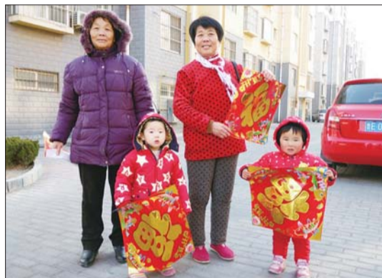
近日,胜利街道胜景社区举行“福文化”巡展暨新春送福活动,向辖区500户居民送上春联、“福”字。