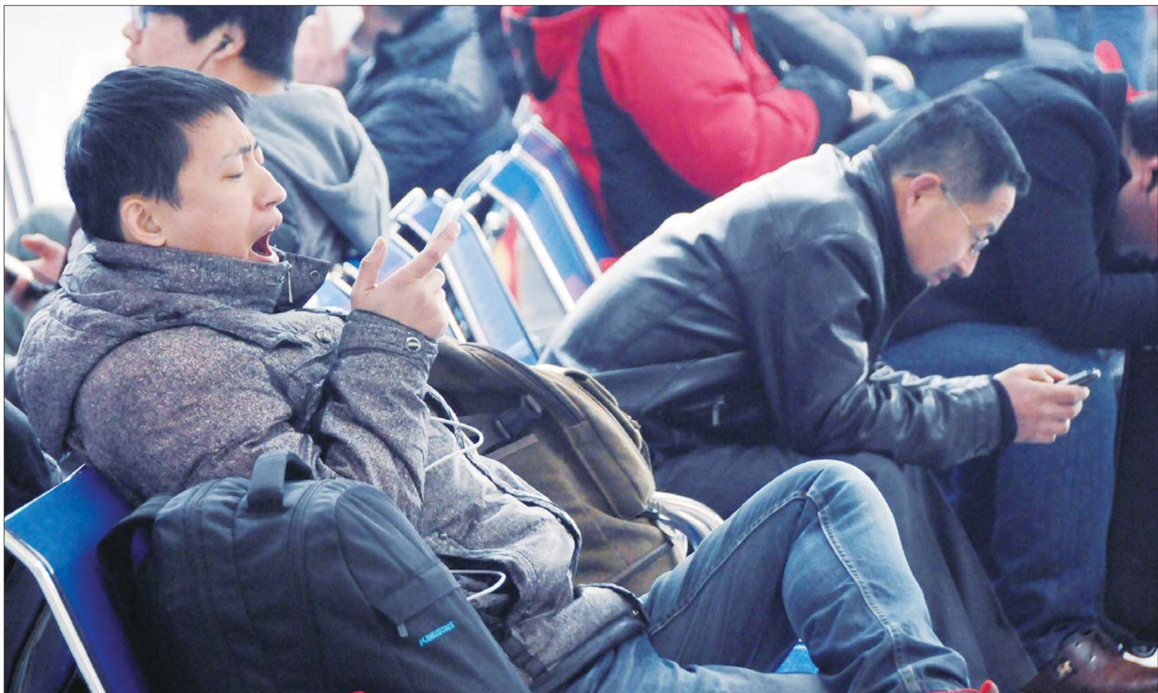
打着哈欠,眼睛也不愿意离开手机。

据介绍,因不知情或图方便,许多旅客会将油漆、发胶、摩丝等违禁物品混进行李中,为了保证乘车旅客的安全,安检机就变得不可或缺。“这个安检机就像是医院的B超机,为了识别包裹里是否有违禁物品,不仅要仔细识别电脑上形成的影像,更要‘眼观六路’。”