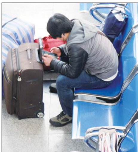
候车椅上,看手机成为最多的风景。