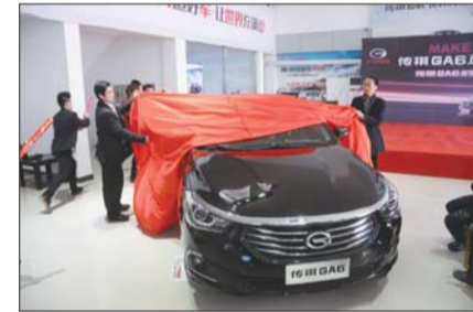
广汽传祺GA6上市。

发布会现场,本报组织了20余名小记者参与看表演、画新车活动。小记者们纷纷表示既好玩又能学到很多新知识,为新车发布现场带来了不少人气。(李立红)