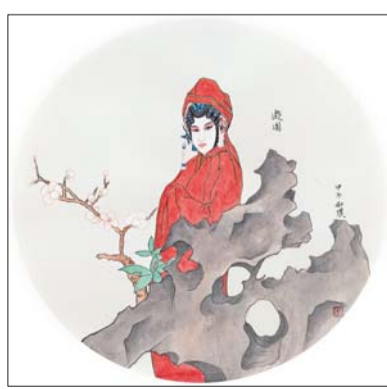
工笔作品《牡丹亭-游园》 创作时间:2015年