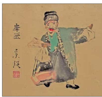
水墨戏曲人物画《庸医》 创作时间:2005年