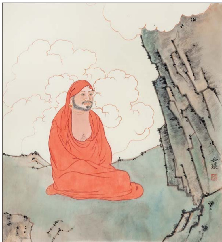
工笔作品《达摩面壁》,创作时间:2014年