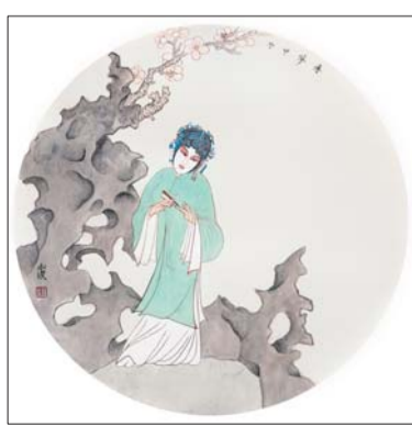
工笔作品《牡丹亭-寻梦》 创作时间:2015年