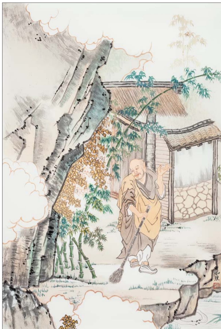
淡设色小写意作品《扫地僧》,创作时间:2014年