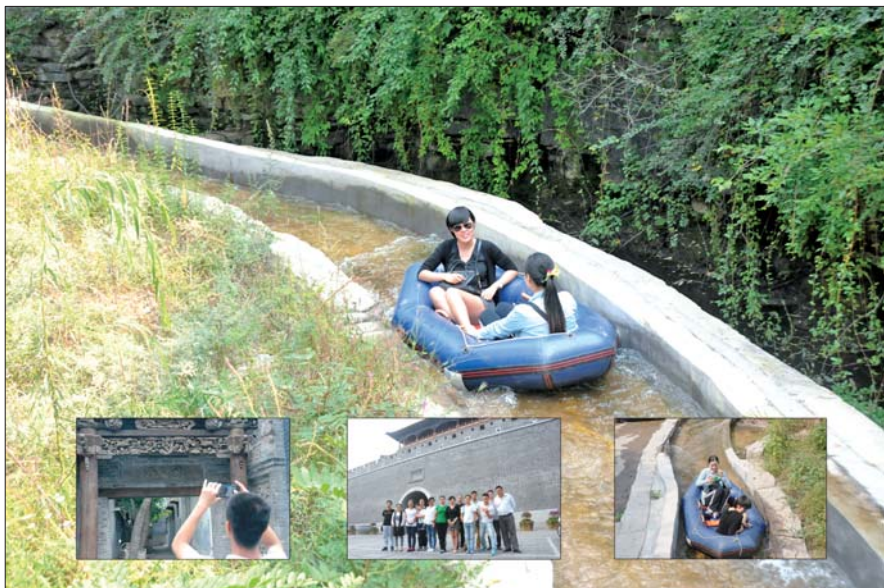
一次出游,让大家从陌生人变成了朋友。

19日晚7点,黄三角早报“爱之旅”大巴缓缓回到市区,本次青州一日游圆满结束。黄花溪景区风景秀丽凉爽宜人,青州宋城古槐苍劲巷陌深深,一天的旅程充实又尽兴。有人带回了在古城里买回的特产,有人带回了山上采来的植物,有人带回了美丽的风光照片。下次旅程,我们还要一起约!