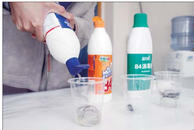
将84消毒液倒入装有头发的塑料杯中。

市自来水公司工作人员说,除了无来电显示的电话外还有以‘019’等数字开头的电话,那都是诈骗电话,如果按照语音提示操作,极有可能造成个人及银行账户信息泄露,产生不必要的损失。市自来水公司工作人员提醒各用水企事业单位及个人,加强防范意识,不要给陌生电话回电,更不要向陌生来电提供银行账户等个人信息,谨防上当受骗。市自来水公司语音催费电话为,8333322。如对水费相关问题有疑问,可拨打客服热线8318911咨询。