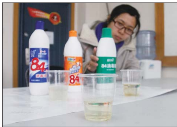
30分钟后其中一个杯子内的头发已经消失。